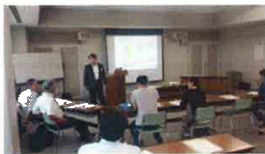
ワークショップ風景(イメージ)